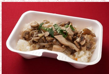
チキンとキノコのピラフ (400 円)