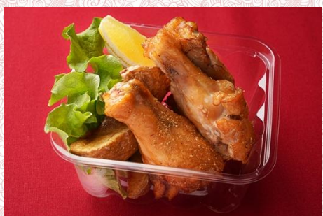
若鶏手羽元の燻製とポテト (500 円)