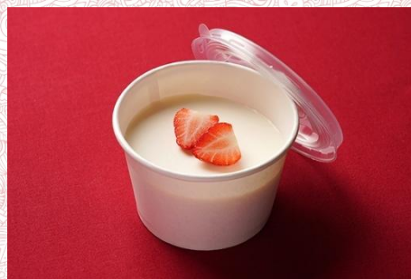
ブランマンジェ(ミルクプリン) (400 円)