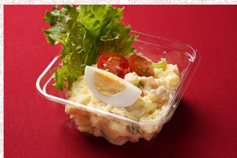
特製ポテトサラダ (300 円)