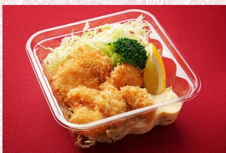
鱈・小海老・プチホタテのフライ (500 円)