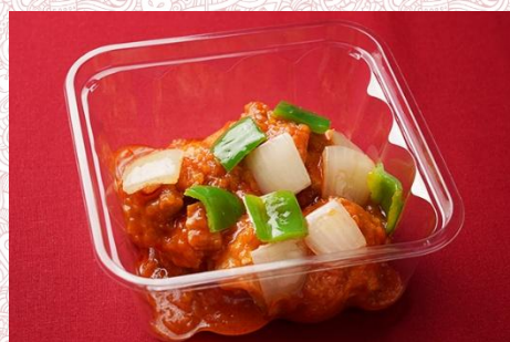
若鶏もも肉柔らか煮バーベキューソース (500 円)