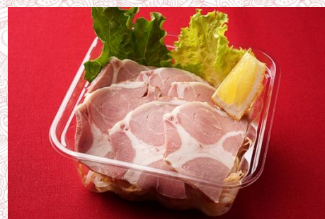
豚肩ロースの洋風焼き豚 (500 円)