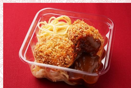
メンチカツ デミグラスケチャップソース (500 円)