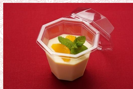
カスタードプリンオレンジ添え (500 円)