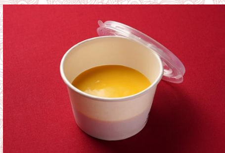
かぼちゃクリームスープ (400 円)