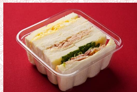
サンドウィッチセット (400 円)