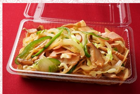
和風スパゲッティ (400 円)