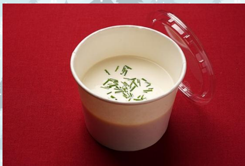
ポテトのクリームスープ 600 円

北斗文化学園インターナショナル調理技術専門学校 学生運営レストラン CHALLENGE SHOP