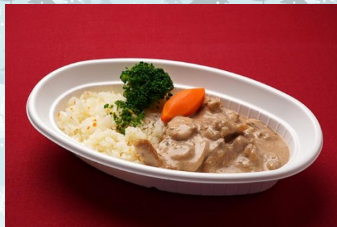
チキンストロガノフ バターライス添え 800 円