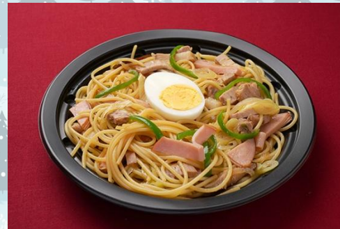
和風スパゲッティ 800 円