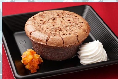
クーランショコラ 600 円