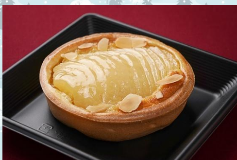
タルト・ブルダレー 600 円