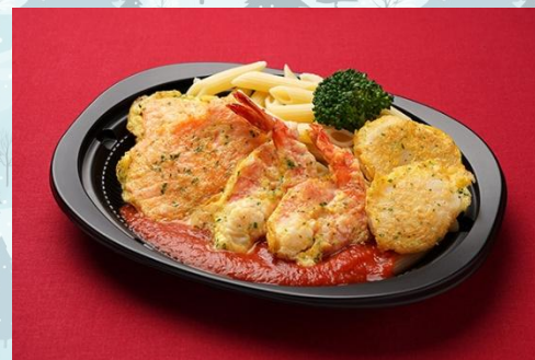
海老と帆立貝、鮭のミラノ風 トマトソース ペンネ添え 1,000 円