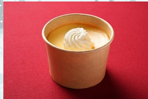
カスタードプリン 300 円