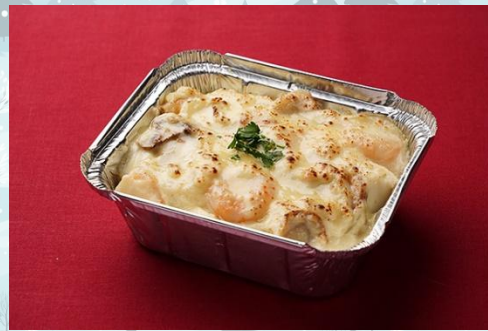
小海老と帆立貝のクリームドリア 800 円