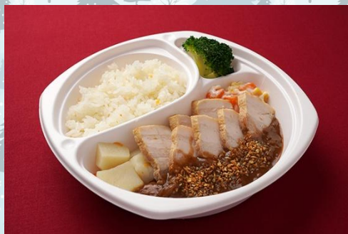
豚バラ肉のやわらか煮 オニオンソース バターライス添え 900 円