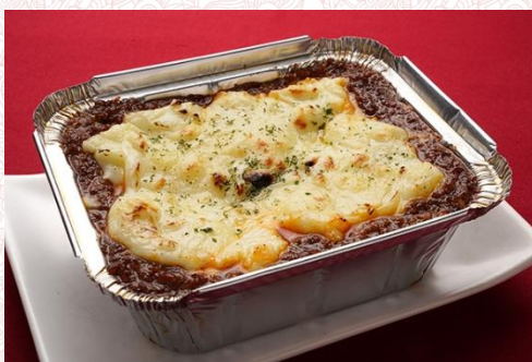
ラザニア 900 円