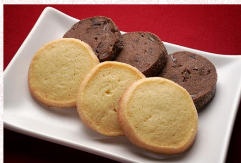
ダイヤモンドクッキー (各3枚) 400 円