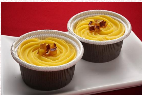
スイートポテト (2 個) 500 円