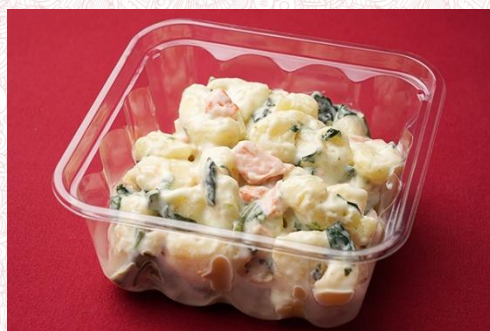
サーモンクリームのニョッキ 600 円