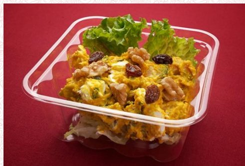
かぼちゃサラダ 500 円