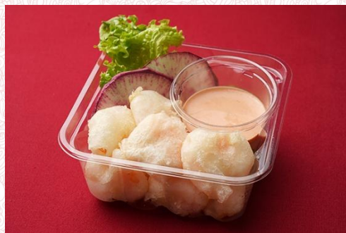
海老フリット (8 個) オーロラソース添え 400 円