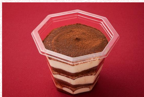
ティラミス 500 円