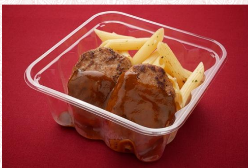
ミニハンバーグ (2 個) ペンネ添え 600 円