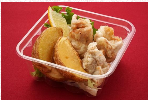
フライドチキン&ポテト 400 円