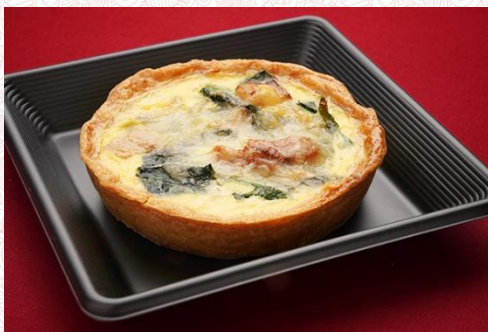
ほうれん草のキッシュロレーヌ 400 円