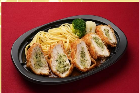
若鶏のかつlets香草バター仕立て シヤスールソース 800 円