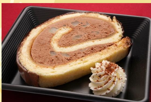
洋梨のチョコロールケーキ 500 円