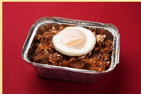
ビーフグラタンライス フライドエッグ添え 800 円