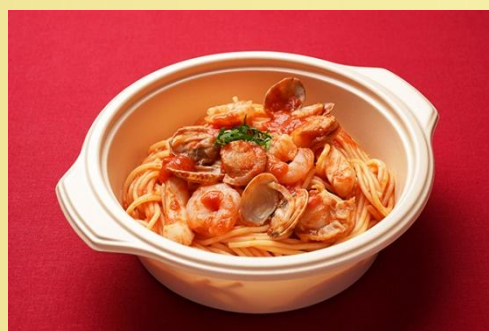
スパゲッティ海の幸のペスカトーレ 900 円