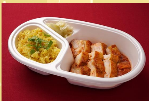
タンドリーチキンカレー ターメリックライス 800 円