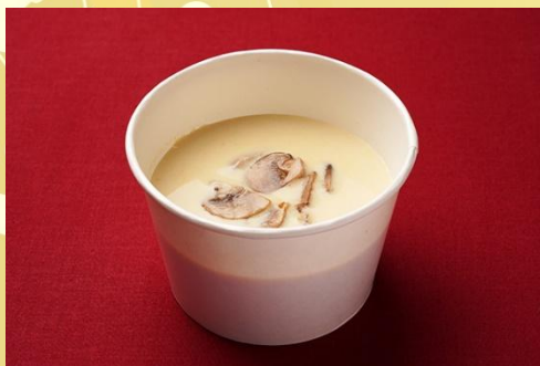
牛蒡とキノコのクリームスープ 600 円