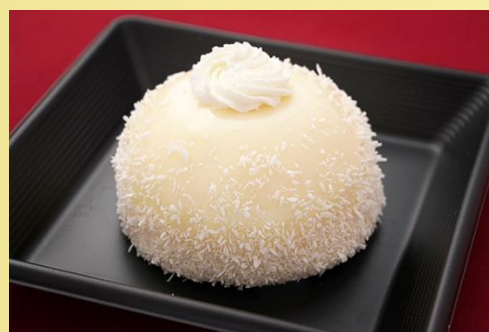
マンゴーとココナッツのドームケーキ 600 円