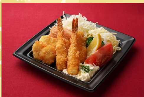
シーフードミックスフライ スパゲッティサラダ添え 1,000 円