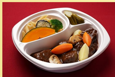
和牛の柔らかビーフシチュー 小野菜添え 1,600 円