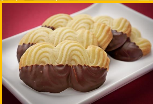
スプリッツクッキー (5 枚) 350 円