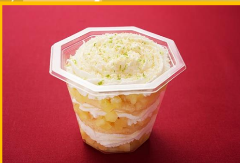
パイナップルとココナッツの ヴェリーヌ 600 円