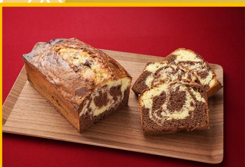
チョコマーブルパウンドケーキ 2 枚 350 円 5 枚 800 円 ホール (10 枚相当) 1,500 円