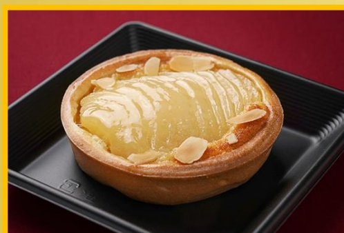
タルト・プールダルー 600 円