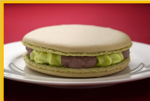
抹茶あんこマカロン 600 円