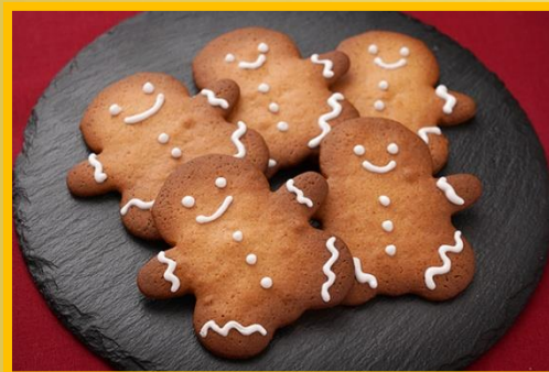
ジンジャークッキー (5 枚) 450 円