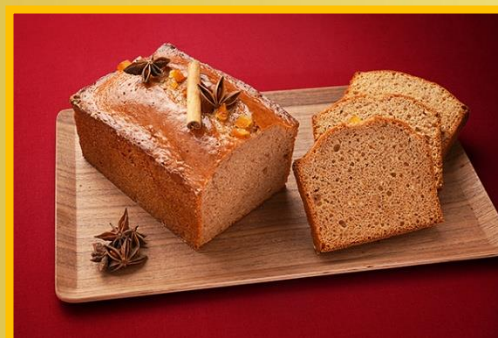
パンデビス 2 枚 400 円 5 枚 950 円 ホール (10 枚相当) 1,800 円