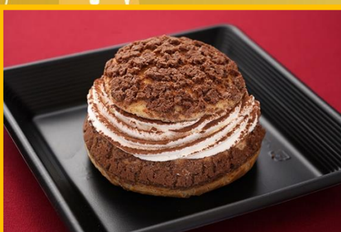
カフェモカクッキーシュー 500 円