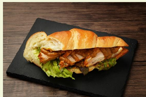
タンドリークロフツサンサンド (500 円)