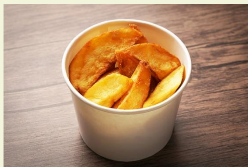
フライドポテト 塩 (300 円)