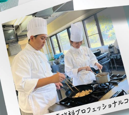
調理師学科・専攻科プロフェッショナルコース