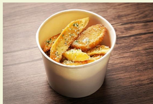
フライドポテト チーズ (350 円)