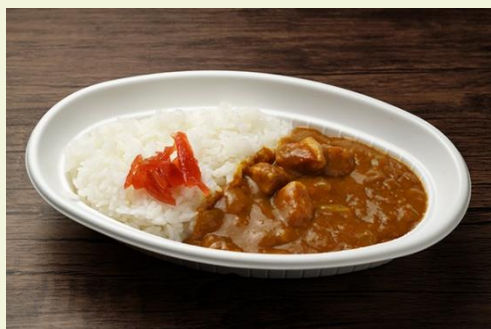
チキンカレーライス (700 円)