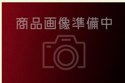
ビーフハヤシライス (700 円)