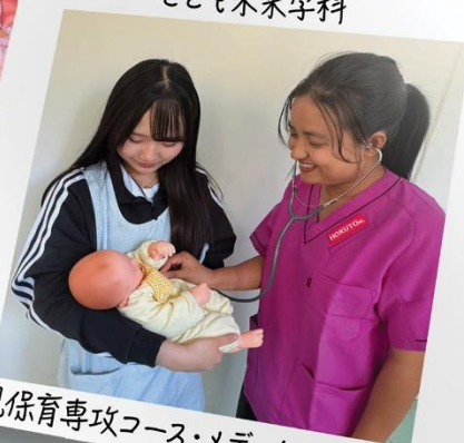
幼児保育専攻コース・メディカル療育コース