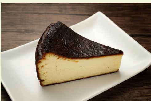
バスクチーズケーキ (600 円)