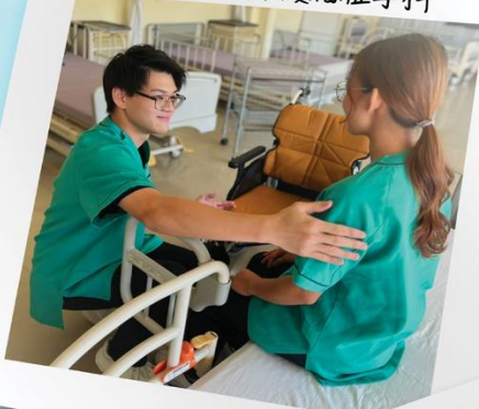
自立支援介護福祉学科