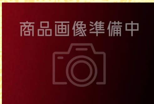
ニラフランボワーズの ハロウィンケーキ (500 円)