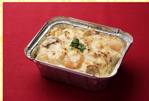
小海老と帆立貝のクリームドリア (800 円)