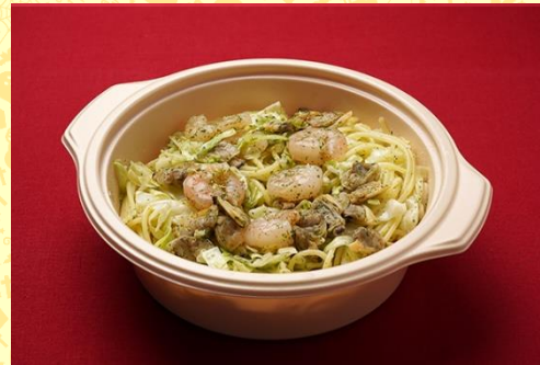
小海老とアサリのキャベツの ハーブバターパスタ (800 円)