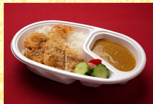
ポークフィレカツカツ特製 カレーライス (1,000 円)