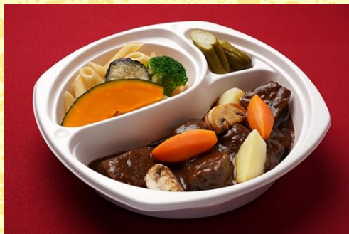
和牛の柔らかビーフステーキ 小野菜添え (1,600 円)