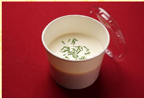
ポテトのクリームスープ (600 円)