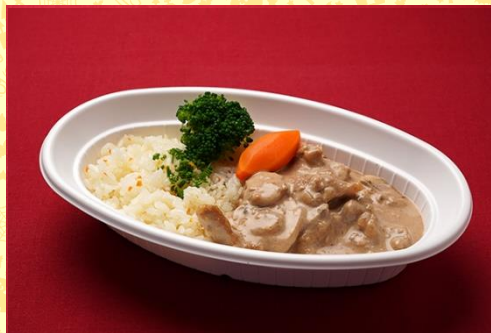
チキンストロガノフ バターライス添え (800 円)