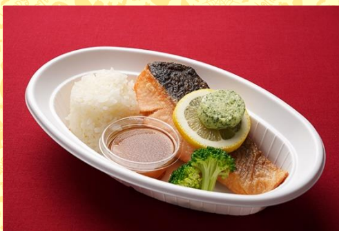
鮭のムニエル バター醤油ソース (900 円) バターライス添え