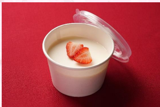
ブランマンジェ(ミルクプリン)イチゴ添え (600 円)