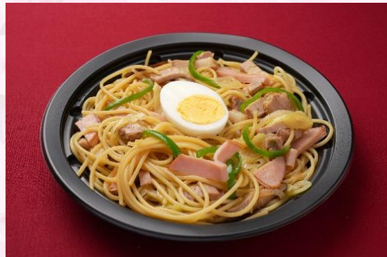
和風スパゲッティ (900 円)