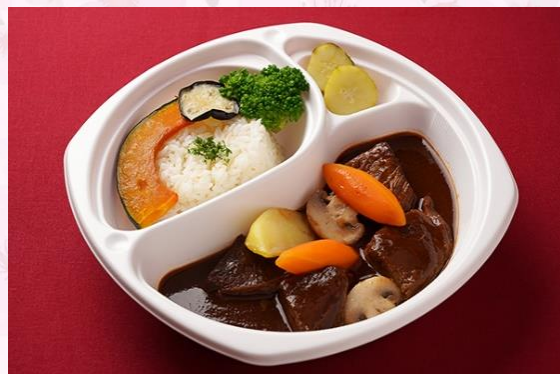
和牛の柔らかビーフシチュー 小野菜添え (1,600 円)