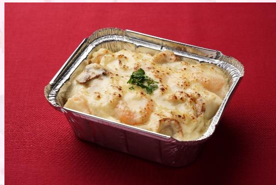
小海老と帆立貝のクリームドリア (800 円)