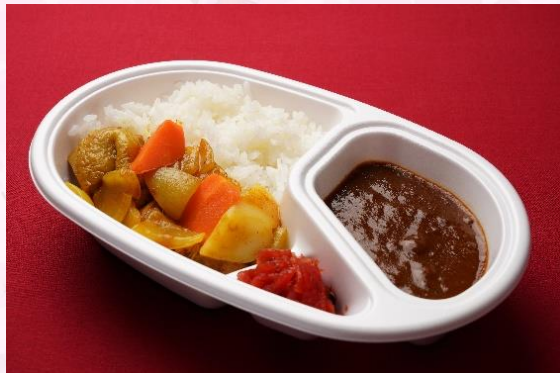
チキンカレーライス (800 円)