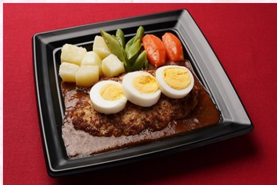
ハンバーグステーキ マデラソース (900 円)