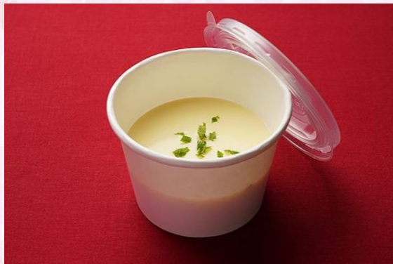
クリームコーンスープ (600 円)