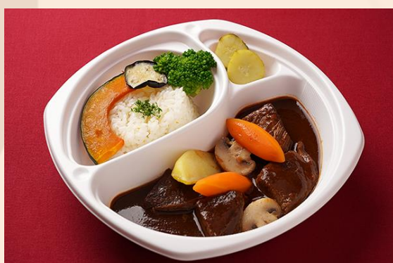
和牛の柔らかビーフシチュー 小野菜添え (1,600 円)