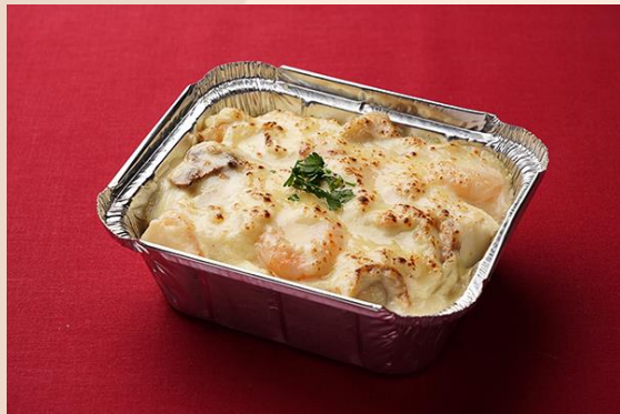
小海老と帆立貝のクリームドリア (800 円)