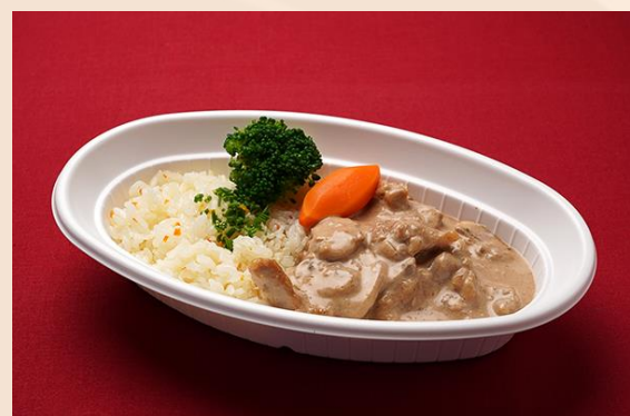
チキンストロガノフ バターライス添え (800 円)