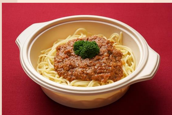
スパゲッティボロネーゼ (800 円)