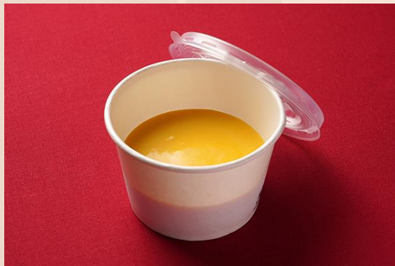
カボチャのクリームスープ (500 円)