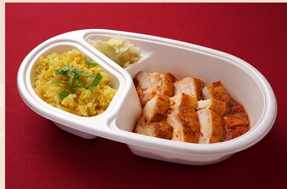
タンドリーチキンカレーライス ターメリックライス (800 円)