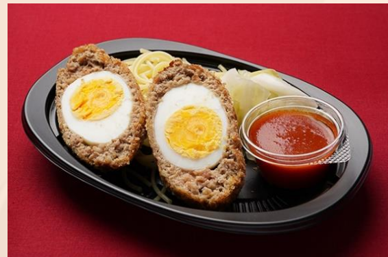
スコッチエッグ トマトソース (700 円)