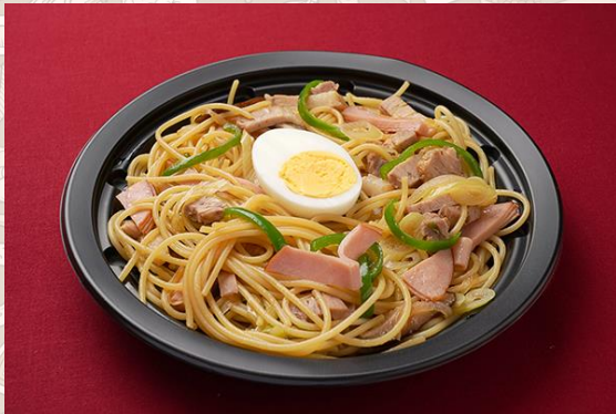
和風スパゲッティ (900円)