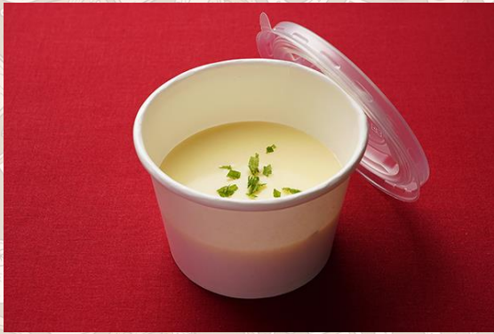
クリームコーンスープ (500円)