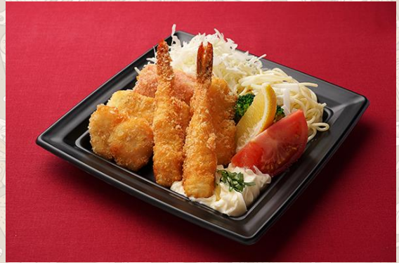
シーフードミックスフライ スパゲッティサラダ添え (1,000円)