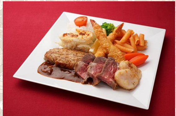
デラックスお食事セット (1,500円)