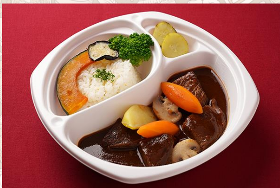
和牛の柔らかビーフシチュー 小野菜添え (1,600円)