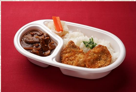
ハヤシライス ポークカツlets添え (1,000円)