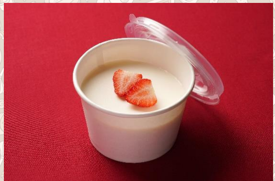
ブランマンジェ(ミルクプリン) イチゴ添え (500円)