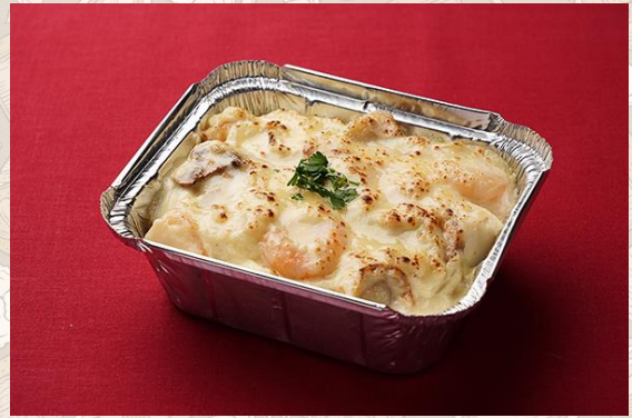
小海老と帆立貝のクリームソリア (800円)