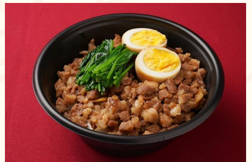
滷肉飯 / 煮込み豚肉かけ御飯 (800 円)