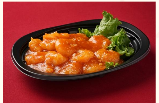
乾焼蝦仁 / 海老のチリソース煮 (900 円)