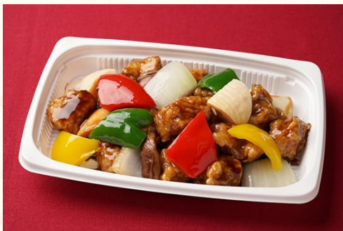
黒醋肉塊 / 黒酢の酢豚 (800 円)