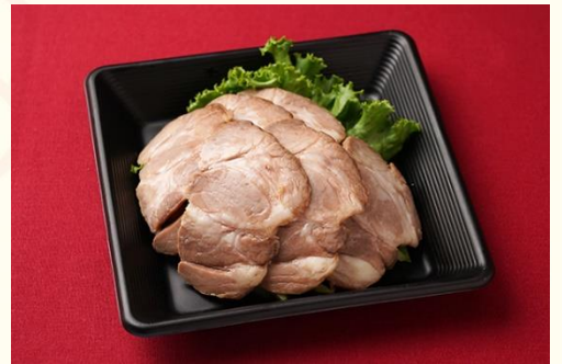
叉焼肉 / 煮豚と野菜の冷製 (600 円)