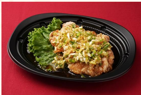
油淋鶏 / 揚げ鶏の油淋ソース掛け (800 円)