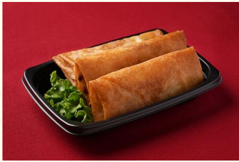
肉絲春捲 / 揚げ春巻き (500 円)