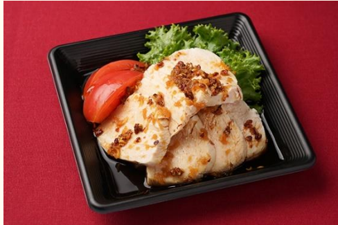
口水鶏 / サラダチキンの辛味ソース掛け (500 円)