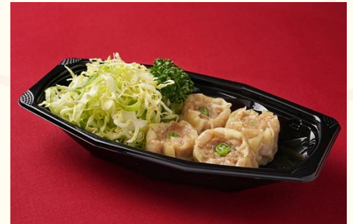
清蒸焼売 / 蒸しシュウマイ (600 円)