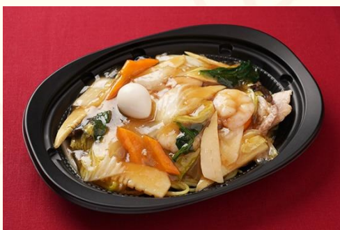
什景炒麵 / 五目あんかけ焼きそば (700 円)