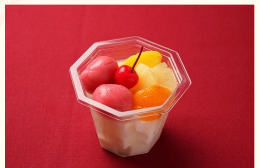
杏仁豆腐 (400 円)