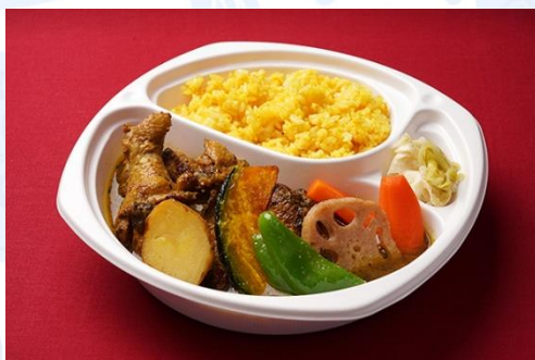
手羽元のエスニックスープカレー (800 円)