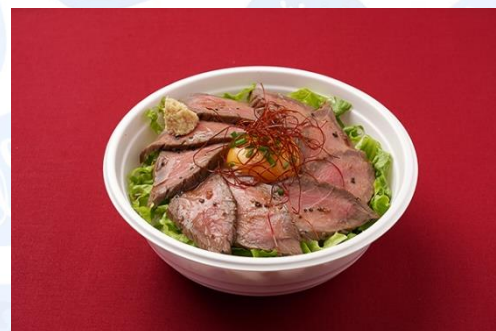
ローストビーフ丼 山わさび添え (1,200 円)