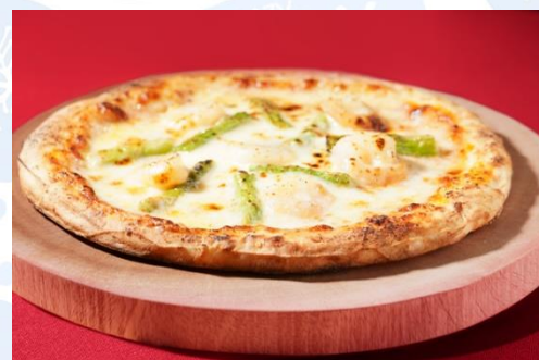
北斗ピッツァ各種 (約18センチ・箱入り) (1,400 円)