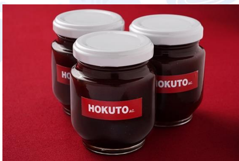
伊達産アロニアのジャム (瓶詰め 140g) (700 円)