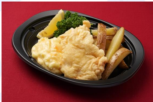
鱈のフィッシュ&チップス (800 円)