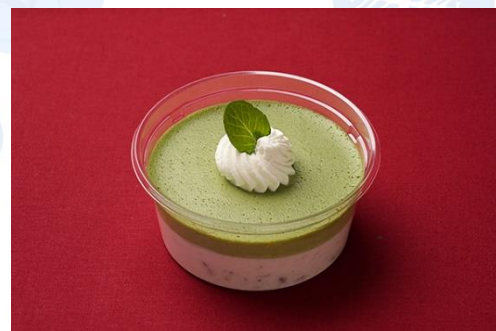
抹茶と小豆のムース (500 円)