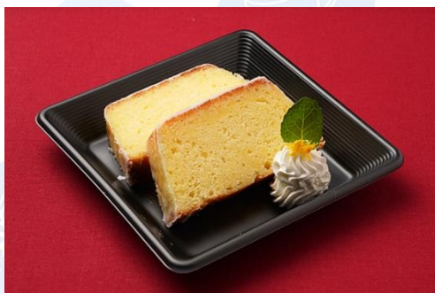
ウィークエンドシトロン (500 円)