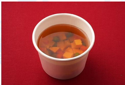
チキンコンソメ ロワイヤル仕立て (500 円)

北斗化学園インターナショナル調理技術専門学校 学生運営レストラン CHALLENGE SHOP