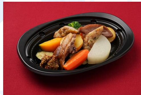
自家製チキンソーセージと鴨コンフィ 温野菜添え (600 円)