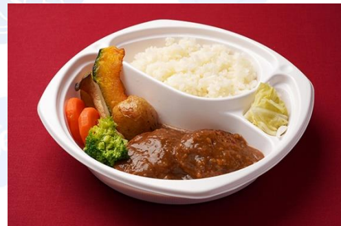
煮込みハンバーグ バターライス添え (800 円)